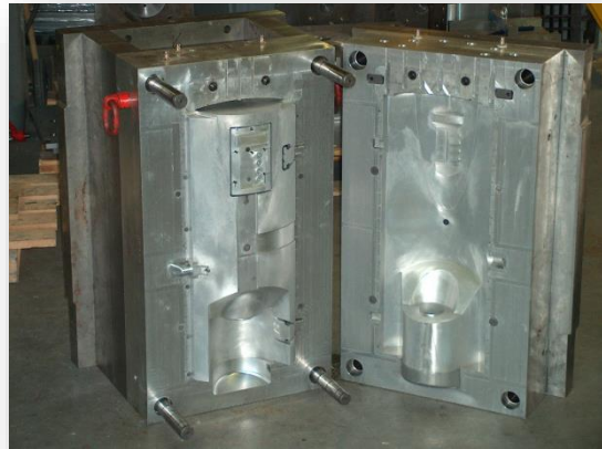
Den Bildern einer Form kann der Hersteller bereits ausführliche Informationen entnehmen.

Diese Angaben sind zur Feststellung der Eignung der neuen Maschine und auch für den Transport mit einem Gabelstapler und/oder einer Kranbahn von Bedeutung.