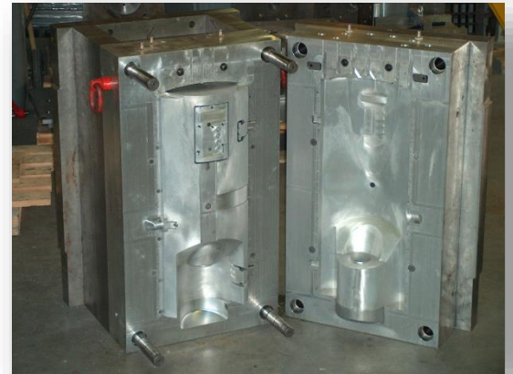
Foto's van een matrijs geven de producent al veel informatie