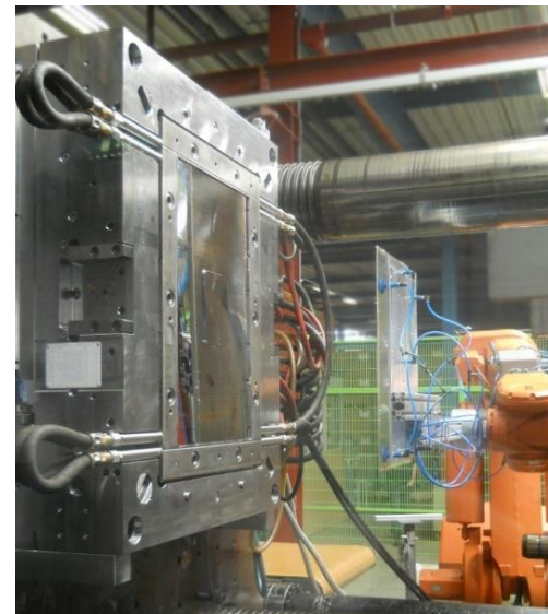
Entnahme der ersten Fresnel-Linsen aus der Form